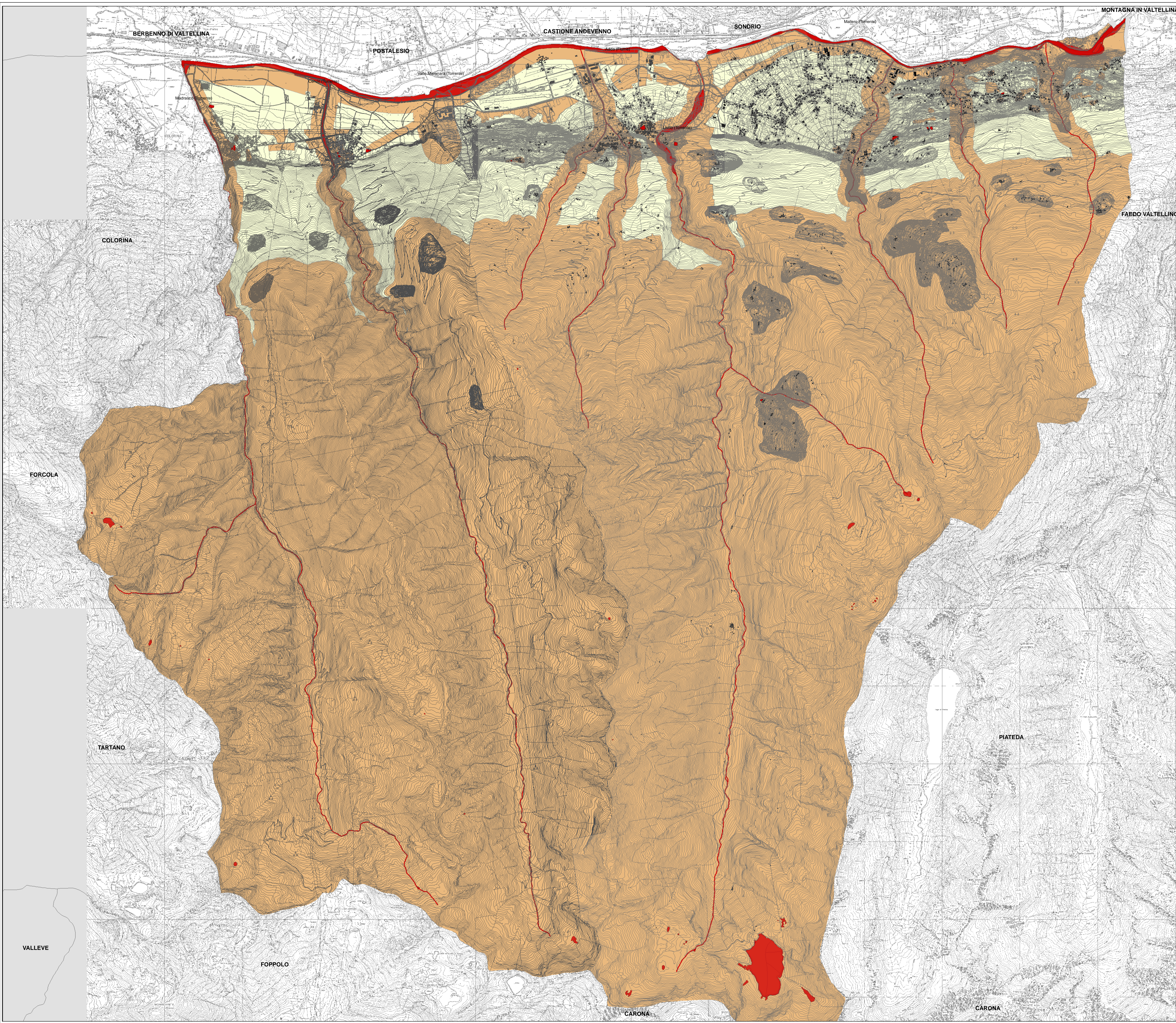
TAVOLA DELLE CLASSI DI SENSIBILITA' CLASSE 3 : classe paesistica media CLASSE 4 : sensibilità paesistica alta CLASSE 5 : sensibilità paesistica molto alta